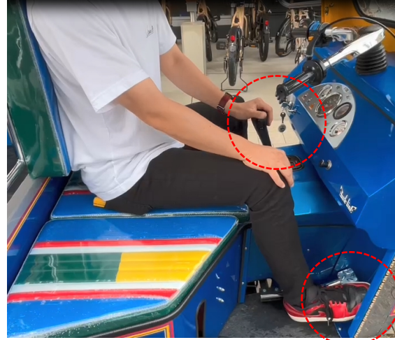
②右足でブレーキを踏ながらギアをドライブ (D) にする。 ※リバースギア (R) にいれるとバックができる