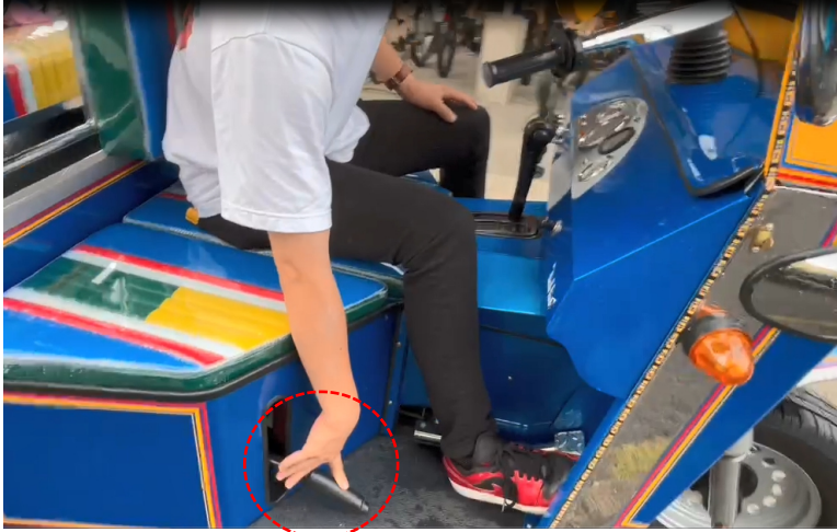
①エンジンを入れ、サイドブレーキを下ろす。