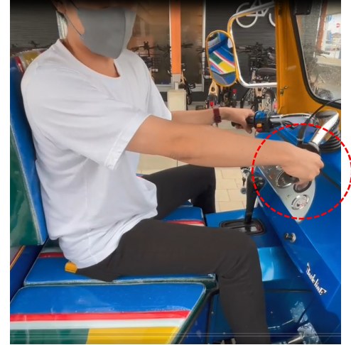
③右足のブレーキを離して、右手のアクセルを回すことで加速する。 ※バックをしたい際は、Rでアクセスを回す。